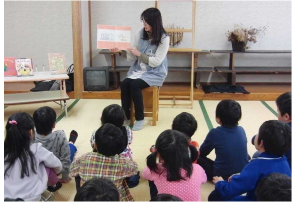
校内読書旬間「読み聞かせの会」

早すぎる大雪で学校に除雪車が入り、バス車庫前や坂道、駐車場の雪を綺麗に除けてくれました。また、6年生が進んで児童玄関前の雪かきをしてくれています。校舎や体育館の周りは、落雪事故のないよう、立ち入り禁止のロープを張りました。8日から冬期間の市営バスを利用した登下校も始まりました。これから、本格的な雪の季節を迎えます。学校生活や登下校で雪による事故のないようにしていきたいと思えます。